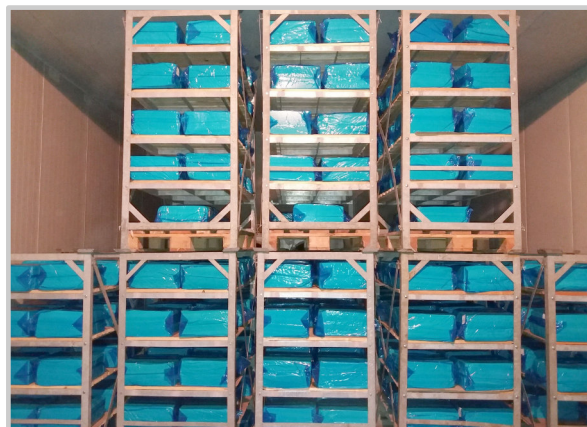
RO: CONGELAREA PRODUSELOR - RAPIDĂ ÎN TUNEL 24H (-18 ... -25°C) - ÎN CUȘTI EN: PRODUCTS FREEZING - TUNNEL AIR BLAST FREEZING 24H (-18 ... -25°C) - IN CAGES HU: TERMÉKEK FAGYASZTÁSA - GYORSFAGYASZTÁS 24H (-18 ... -25°C) - KETRECEKBEN