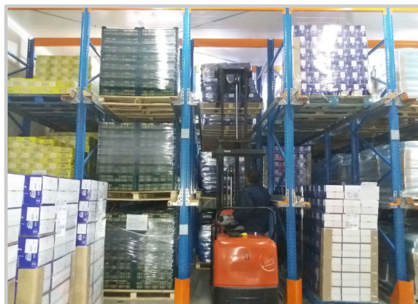
RO: MANIPULAREA MECANICĂ ȘI MANUALĂ A MĂRFII - CU TRANSPALET ȘI STIVUITOR ELECTRIC EN: MECHANIC AND MANUAL CARGO HANDLING - BY ELECTRIC PALLET TRUCK AND FORKLIFT HU: MECHANIKUS ÉS KÉZI ÁRUKÉZELÉS - ELEKTROMOS RAKLAPEMELŐ ÉS TARGONCA SEGÍTSÉGÉVEL