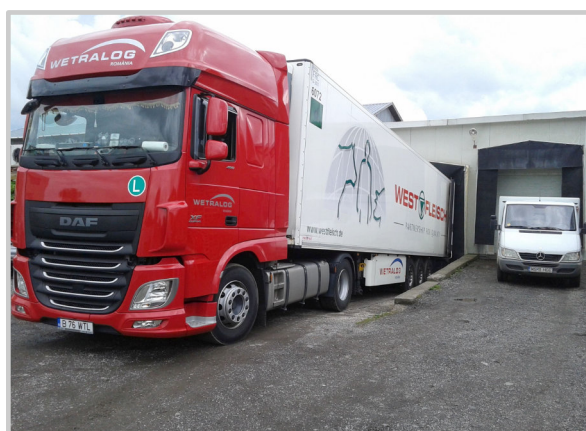
RO: MANIPULAREA MĂRFII - RAMPA DE DESCĂRCARE-ÎNCĂRCARE PENTRU TIR-URI ȘI MAȘINI MAI MICI EN: CARGO HANDLING - UNLOADING AND LOADING RAMP FOR TRUCKS AND SMALLER CARS HU: ÁRUKÉZELÉS - RAKODÓ RÁMPA NAGY AUTÓK ÉS KIS AUTÓK SZÁMÁRA