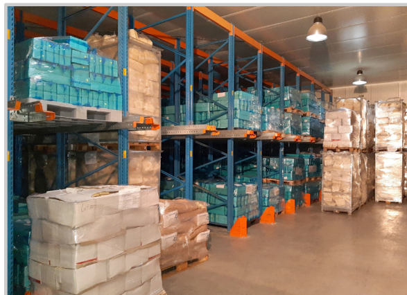
RO: DEPOZITAREA PRODUSELOR CONGELATE (-18° ... -20°C) - PE SISTEM DE RAFT EN: FROZEN PRODUCTS STORING (-18° ... -20°C) - ON SHELF SYSTEM HU: FAGYASZTOTT TERMÉKEK BÉRTÁROLÁSA (-18° ... -20°C) - POLCRENDSZEREN